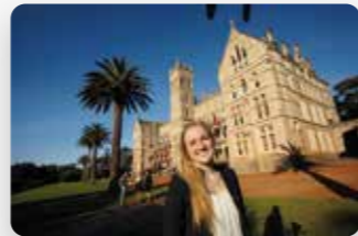
International College of Management, Sydney