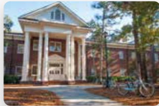
University of North Carolina Wilmington