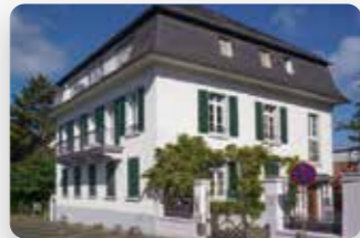
International Student Office, Darmstadt