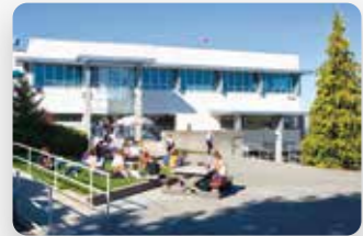
Vancouver Island University, Nanaimo